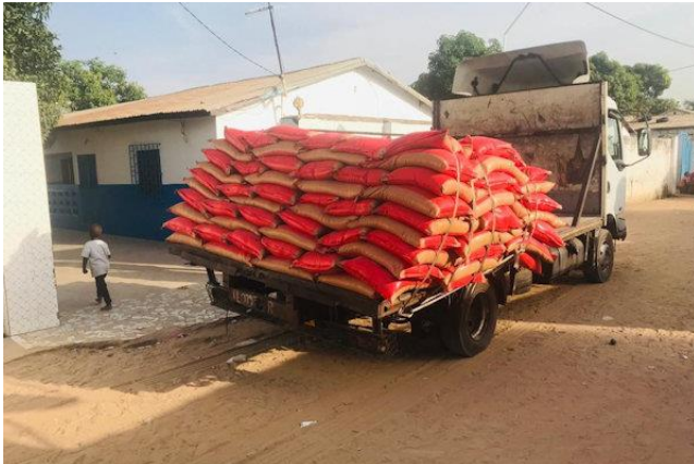
aflevering van rijst in Sukuta Madina

Dankzij de prachtige donaties voor voedselhulp kon in 2021 voor de arme gezinnen voor 7.000 € rijst worden gekocht. Dat waren 560 balen rijst van 25 kg. Helaas was deze hoeveelheid nog niet voldoende om alle noodlijdende gezinnen in Sukuta Madina en Yuna te helpen. In Yuna werd de rijst in wat kleinere porties verdeeld.