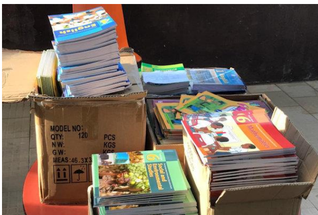
Lesboeken voor de kinderen

De scholen in Gambia zijn het gehele jaar normaal open geweest zodat geïmproviseerd thuisonderwijs niet nodig was. Het aantal geconstateerde Covid-19 besmettingen is nog steeds relatief gering, en dat geldt zeker ook voor de scholen. Ook voor het schooljaar 2021-2022 is weer geld beschikbaar gesteld voor een setje lesboeken voor de kinderen van de school. Het schoolterrein van de Primary school is voorzien van een mooie tegelvloer zodat er niet meer zoveel zand de school inwaait. Dit schooljaar 2021-2022 heeft de school 565 kinderen, 210 in de Nursery en 355 in de Primary.