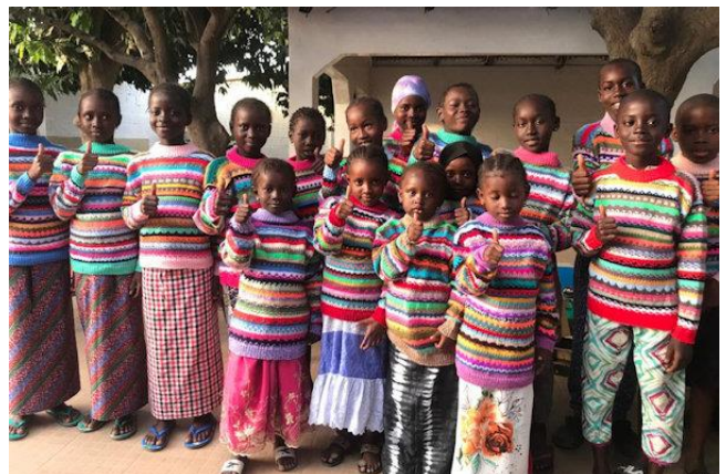
en gebreide truien