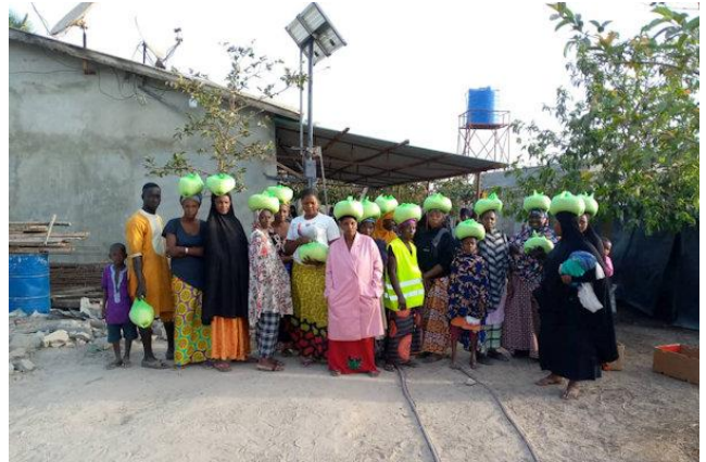
vrouwen met rijst in Yuna