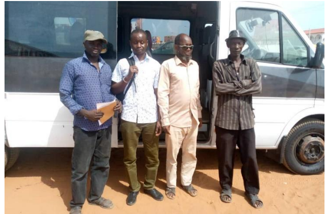
mensen van de Govi blindenschool bij de bus