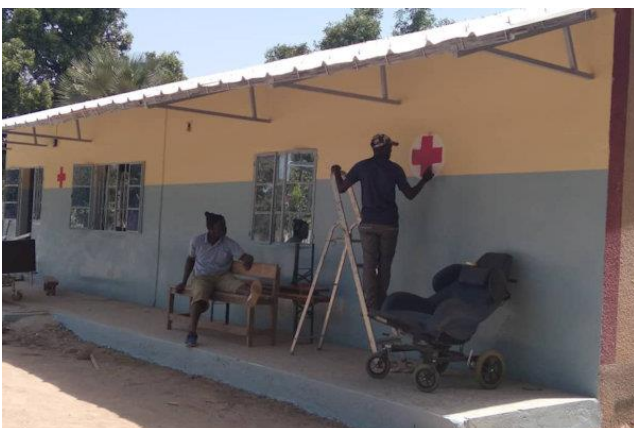
het gerenoveerde gezondheidscentrum

De renovatie van het gezondheidscentrum in Macouda in Senegal, een project van onze ambassadeurs Amy en Frans, is in 2021 afgerond. De renovatie omvatte vervanging van dakplaten en plafonds, vernieuwing van de elektrische installatie, wastafels in de behandelkamers, installatie van een solar waterpomp systeem, bouwen van een apart toiletgebouw met doucheruimte en het (binnen en buiten) schilderen van het gebouw. Door deze renovatie kan het gezondheidscentrum weer jaren vooruit.