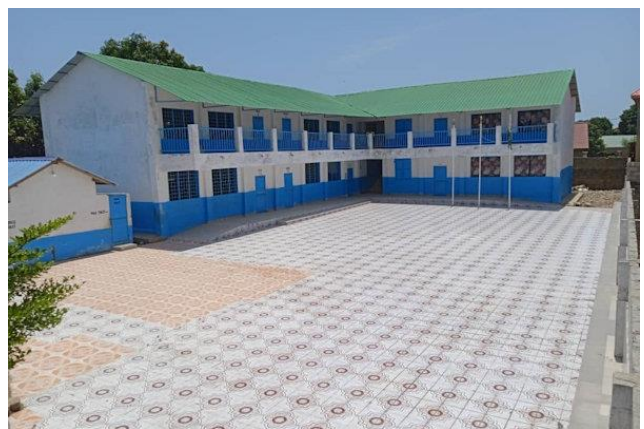
Primary school Sukuta Madina