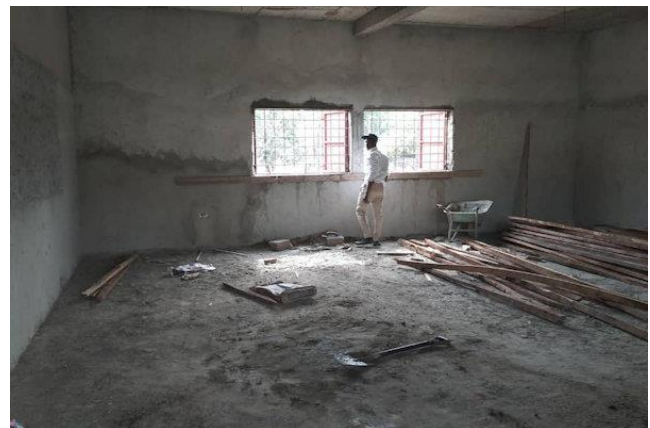
leslokaal van binnen